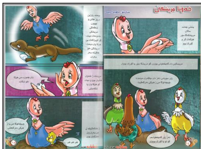
چىرۇكا وئەندار ھىزارە (۱)

وھكى ھەر چىرۇكەكا وئەندار، تابلويىن ئەفنى چىرۇكى ھەمى فورمىن چىرۇكى ب خۇفە دكرن، لى ئەو دوىراتيا دئافبەرا جھى وئەندار و پەراويزا بەرپەرىدا نەھاتىه جوداكرن، چونكى ھەر وھكى ژ وئەنى ديار، پەراويزا بەرپەرى (ئافنى گوفارى، ھىزارا گوفارى، ژمارا بەرپەرى) ل گەل جھى وئەندار تىكھەل بووبە.