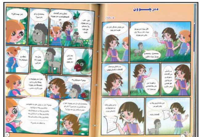
چىرۇكا وىنەدار (۴)

چىرۇك د دوو بەرپەرىن گوفارىدا ھاتتە رىكخستىن، كو ھەمى رەگەزىن فۇرى بىن جىوازىن چىرۇكى د دوو تابلۇياندا رىكخستىنە، ۋەكى: خانە، پىدانگ، چارچۇقە، شەرىت. ل قىرە د شىياندايە بىژىن تا رادەبەكى گونجاندىن و رىكەڧتن دناڧەرا شىسەرى وىنەكىشى چىرۇكىدا نىنە، چونكى كىشاننا وىنان ب ئەوى شىوازى د چىرۇكىدا ديار، بووېه ئەگەرى ژىك قەقەتياڭا باھەت و رويدانىن چىرۇكى.