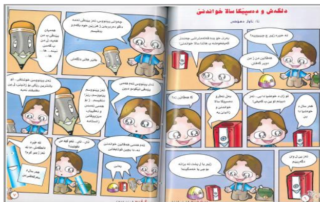
چیروکا و ټه دار (۳)

هه ردوو به رپری چیروک ب شیویه په کی هاتینه رینکخستن، کو ره گزین فوری یین چیروکی ب خوځه دگرن، ل گهل نافونیشانین چیروکی، نافی ناماده کاری، هژمارا به رپری چیروکی، نافی گوفاری، هژمارا گوفاری، کو ل په روازا به رپرانه، هاتینه رینکخستن.